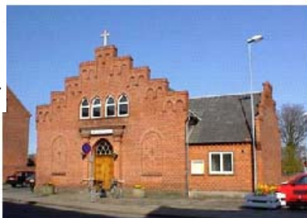
Skive Missionshus i dag